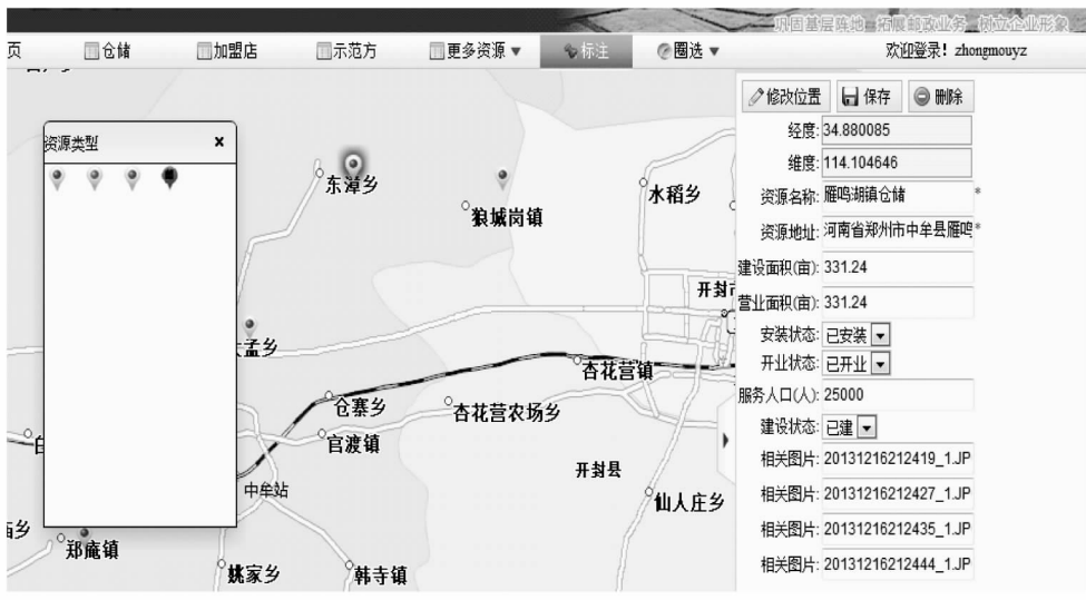
图 3 标注在地图上的仓储信息

利用 GIS 对邮政资源数据进行管理，首先需要自定义邮政各种资源数据，并赋予空间坐标信息，设置位置的经度、纬度，如图 3 所示，仓储在地图上标注现实中的位置。该仓储资源赋予空间坐标信息的资源数据，就可以通过 GIS 地图引擎导入地图数据库中进行管理。